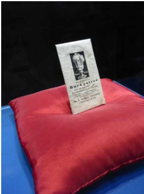
Besonders wertvoll: eine der ersten Tüten mit Backpulver.