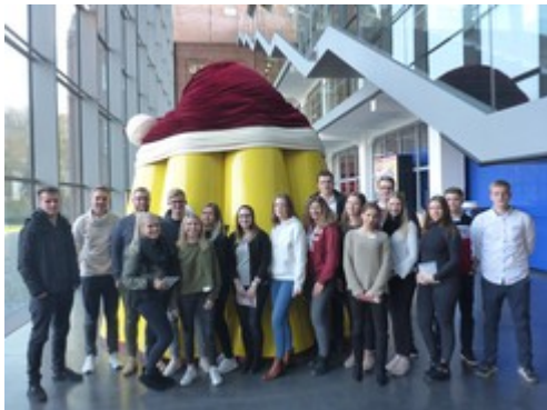
Ein Highlight des Rundgangs: der große Pudding mit Gelegenheit zum Probieren.