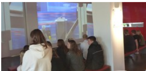
Produktion im Video: Einblick in die Fertigung verschiedener Erzeugnisse.